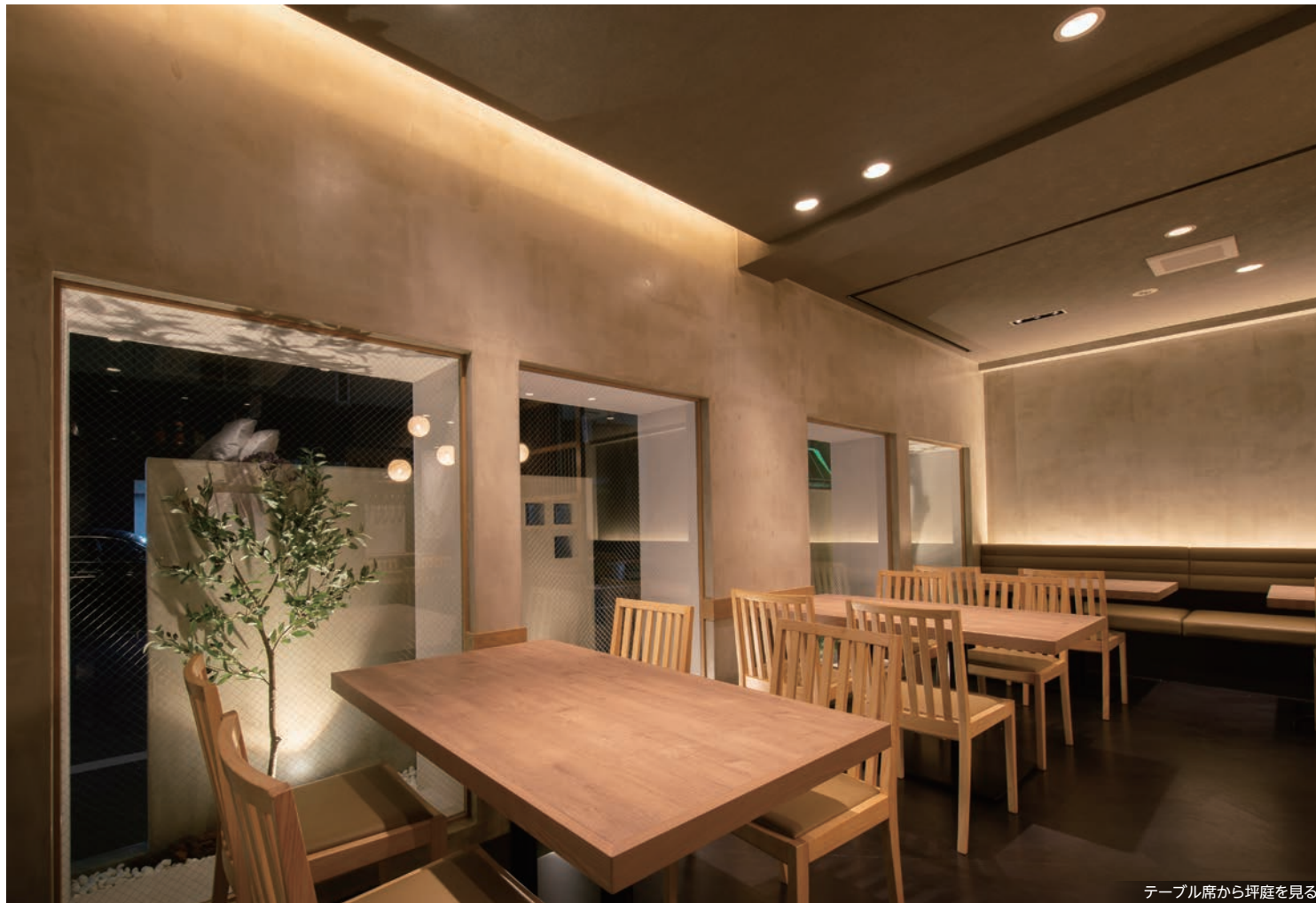
テーブル席から坪庭を見る