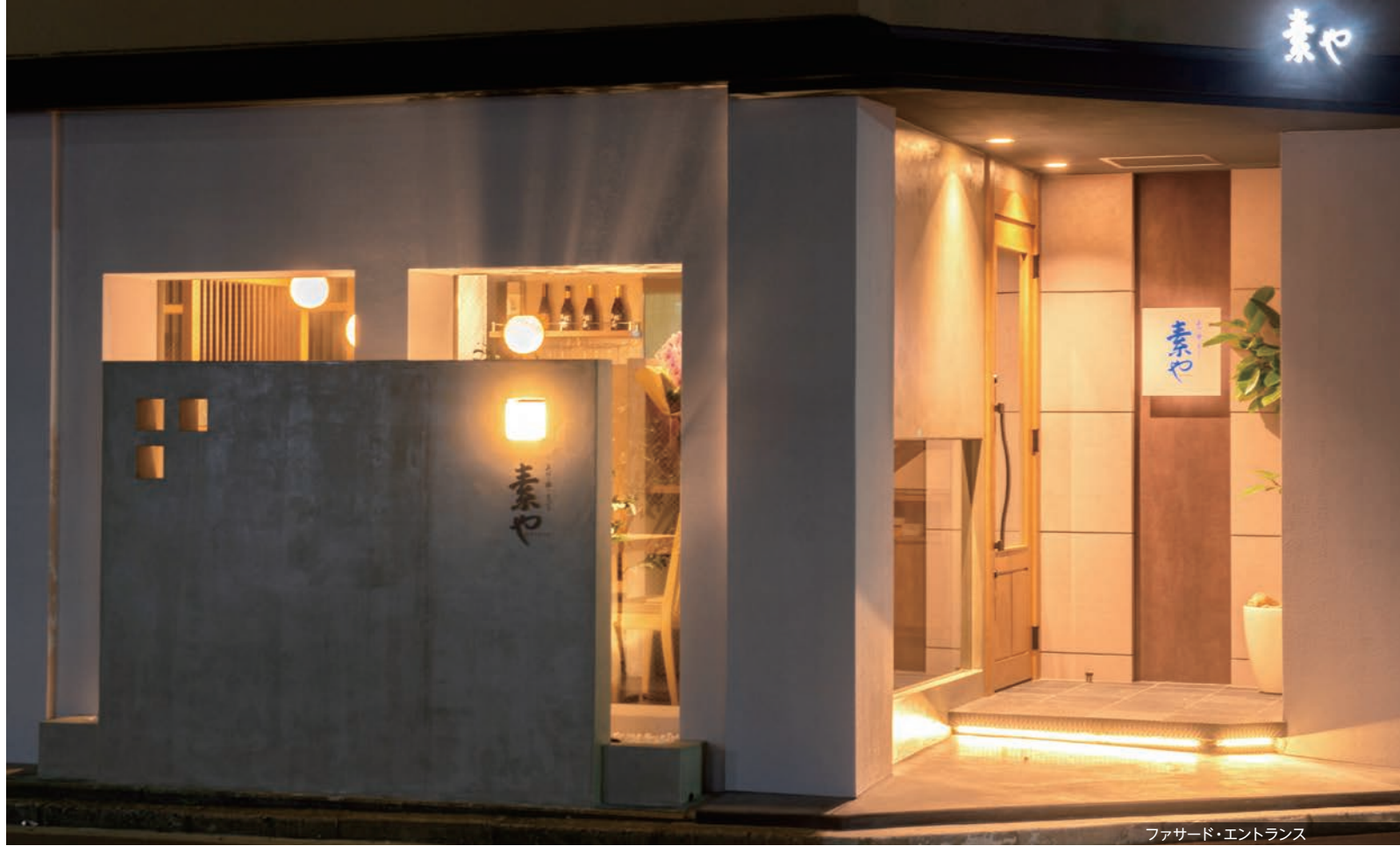
ファサード・エントランス