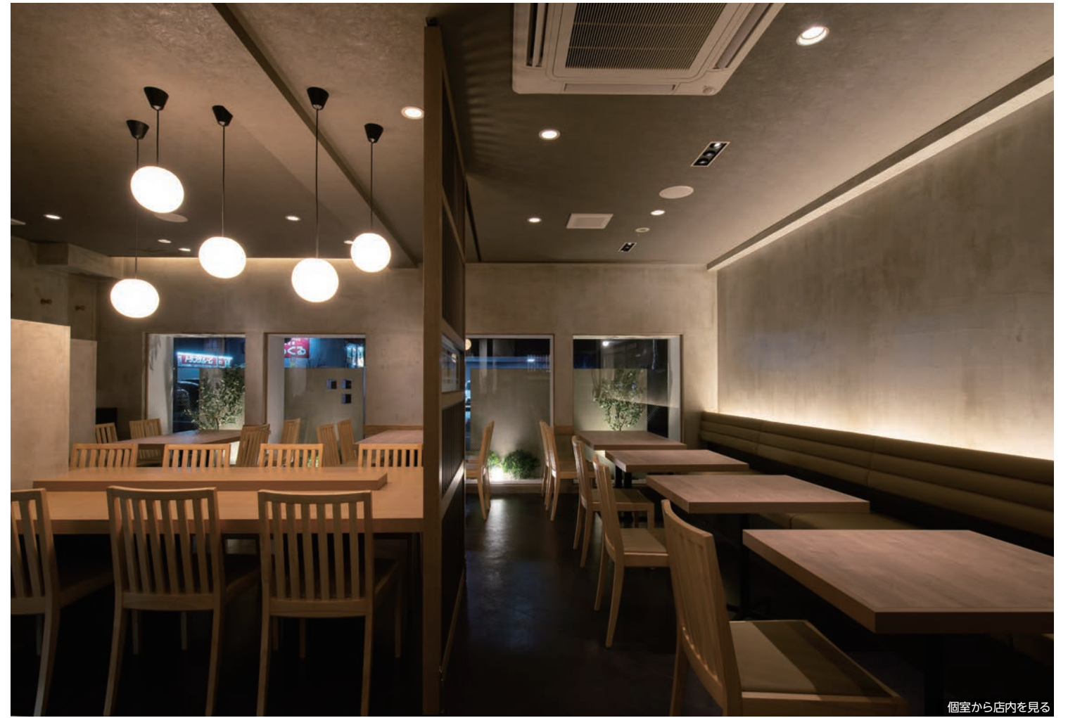
個室から店内を見る