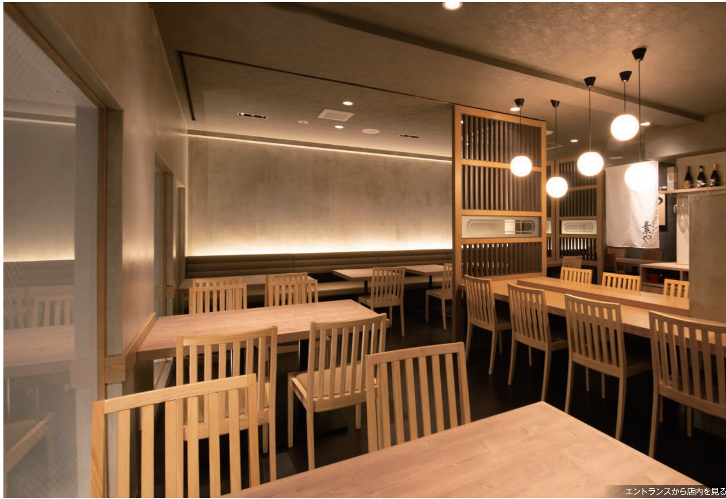
エントランスから店内を見る